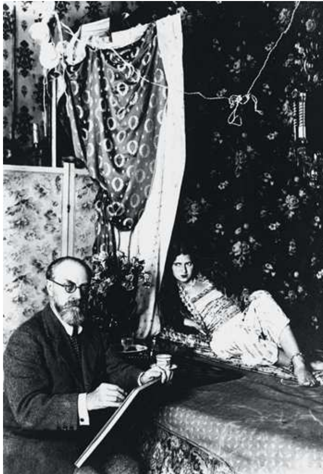
Kazak - 5 - Le processus - http://corner.as.comer.free.fr/kazak.html

Pour ma part, l'attente de la réalisation, à laquelle se conjugue un questionnement (à savoir « pourquoi ce travail ? », « quels en sont les enjeux ? », « quel est mon objectif ? »), me permet de replacer le travail en cours dans une perspective plus large. Son sens s'en accroît d'autant. Cette phase peut être longue ou non. Mais très vite vient s'y joindre une expérimentation. Cette attente, pleine de questionnements et d'expérimentations, ne peut être considérée comme « ne rien faire ». Moment d'extrême activité au contraire : les choix s'y opèrent, les directions se prennent. Si d'un point de vue extérieur la logique et les règles peuvent paraître absentes, une organisation manifeste se dessine.